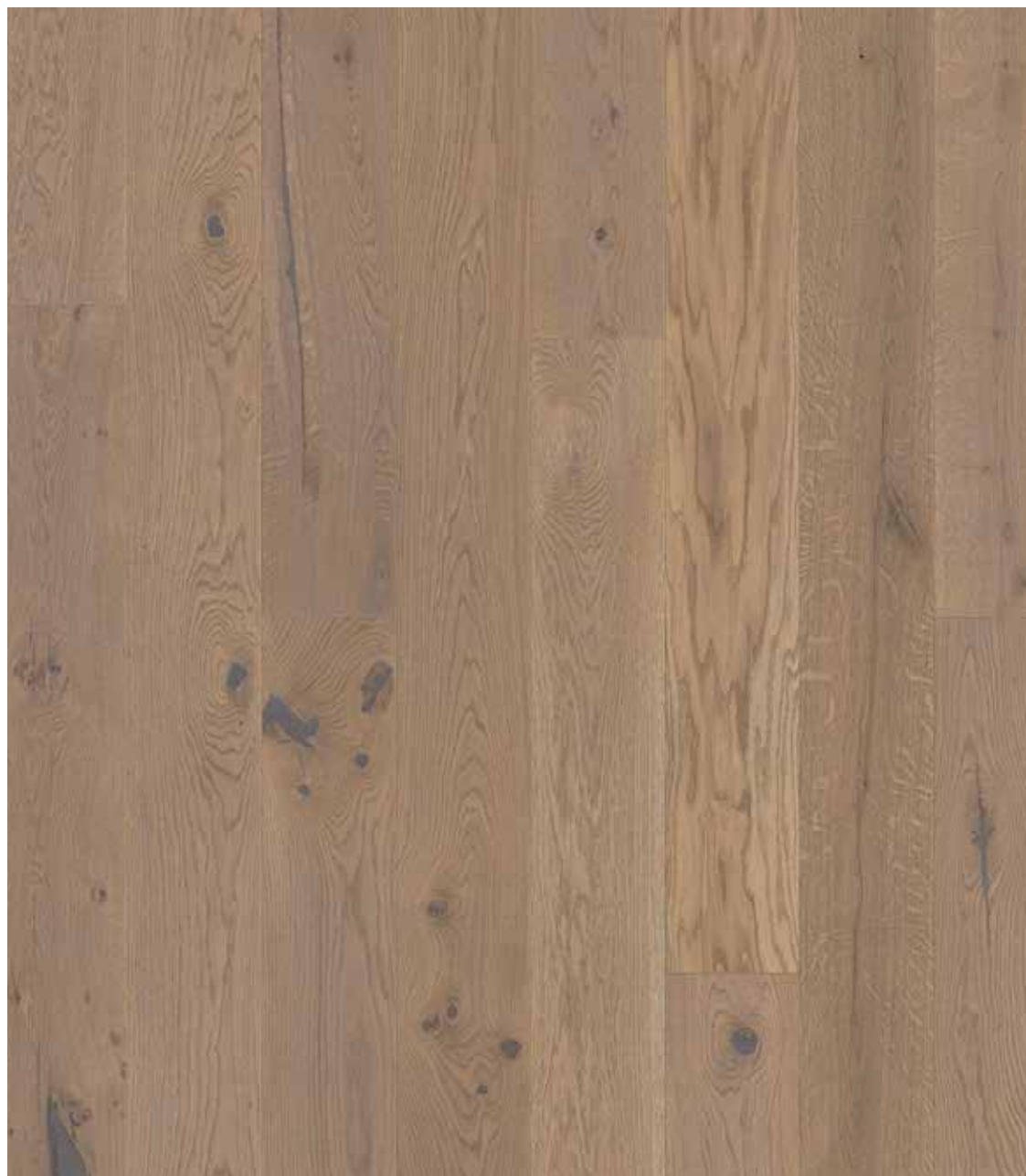
DIELEN-OPTIK | EICHE AUSTER | WILD BUNT (ORIGINAL) GEFAST, GEBÜRSTET