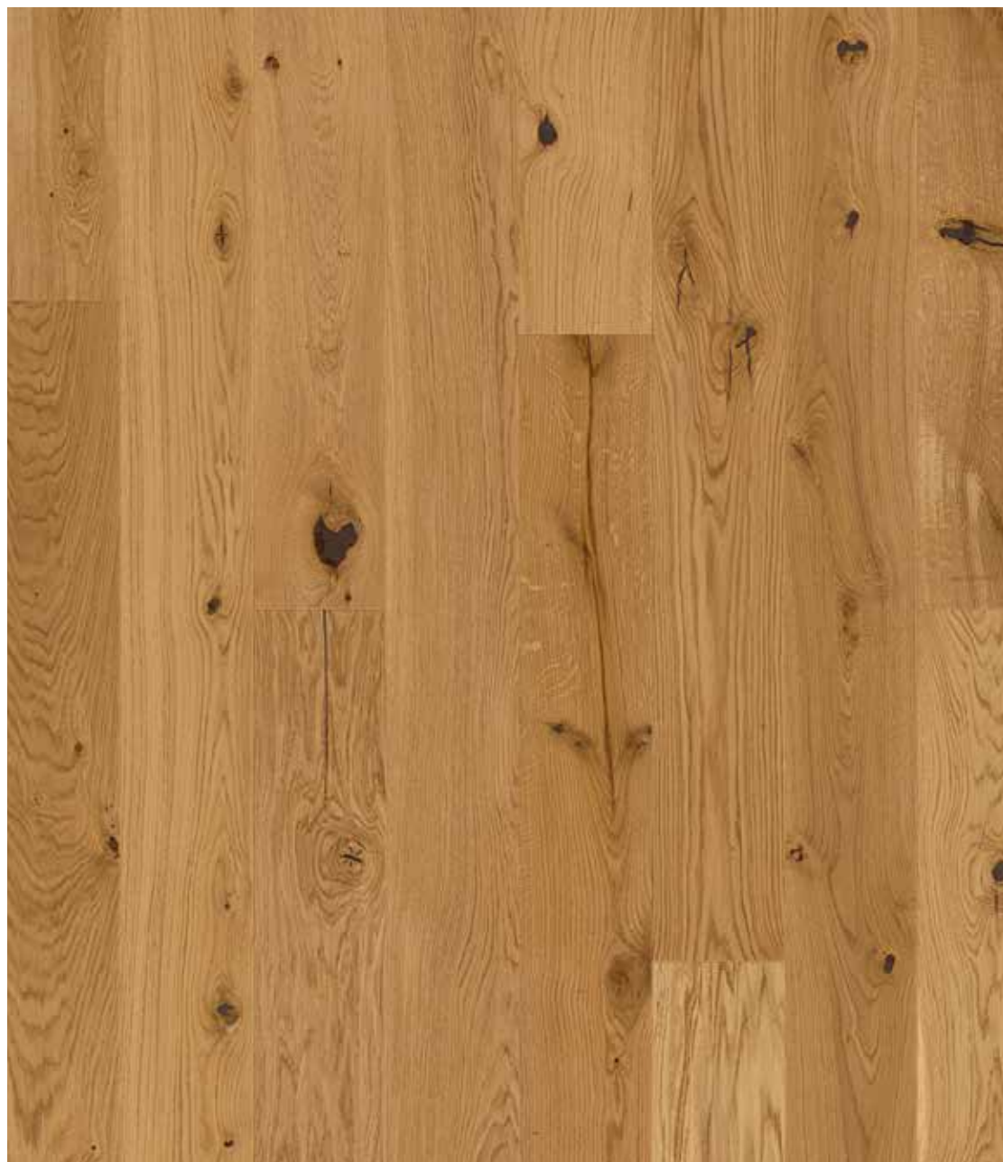
DIELEN-OPTIK | EICHE | WILD* (ORIGINAL) GEFAST, GEBÜRSTET